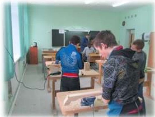
Участие в трудовых делах школы