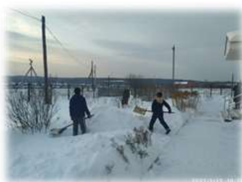
Помощь ветеранам и престарелым Субботник по расчистке снега