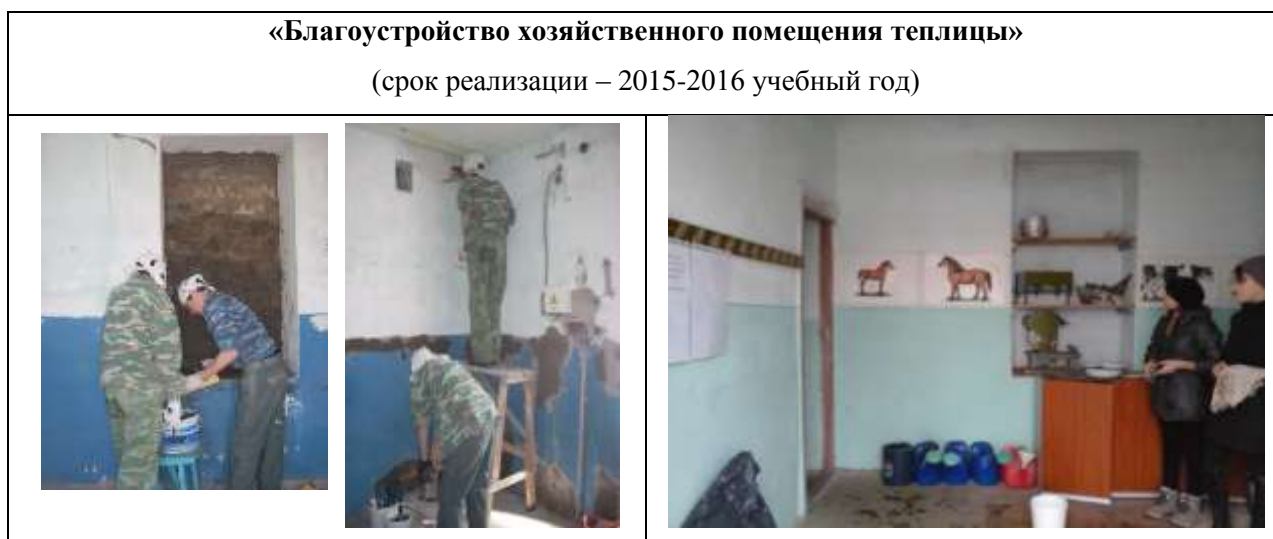
Подпроект «Реставрация тёплого перехода школы»

План подпроекта был полностью реализован. Строительная бригада отремонтировала помещение кладовок: побелили потолки; покрасили стены водоэмульсионной краской; сделали отводку панелей филёнкой по трафарету; заштукатурили оконный проём, ранее заложённый кирпичом, в котором рабочий сделал полки под мелочи.