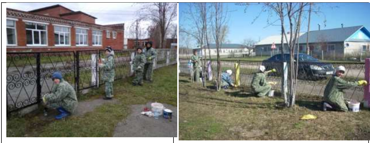
Акция «Моя школа»

Цель: совершенствование интерьера школы и классных кабинетов.