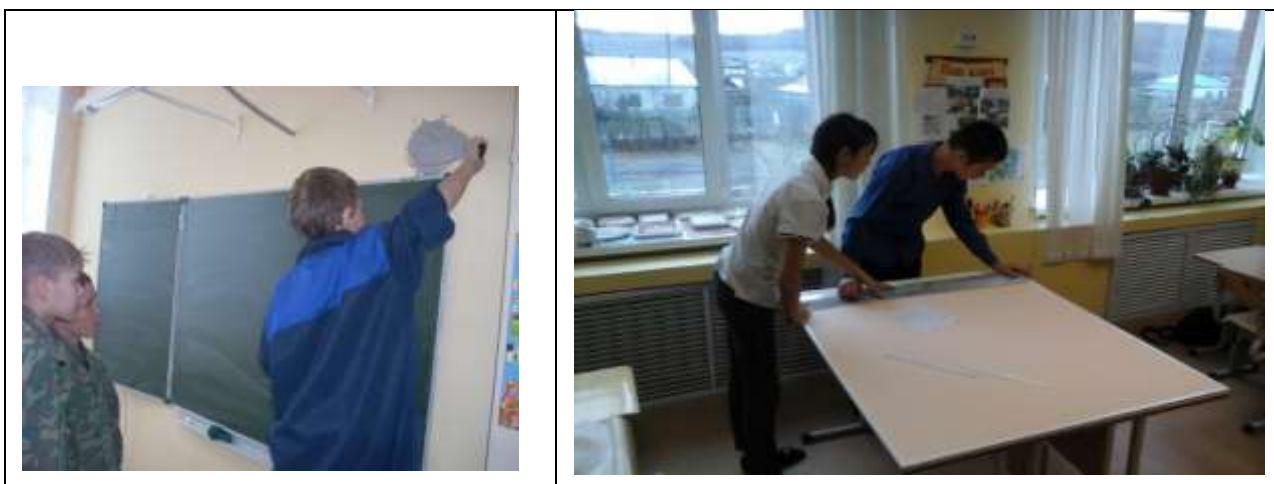
Акция «Подарок жителям деревни!»

Содержание деятельности: изготовление стендов, оформление их кармашками для информационного материала в едином стиле образовательного учреждения; косметический ремонт внутри помещения школы (шпатлевание стен, покраска).