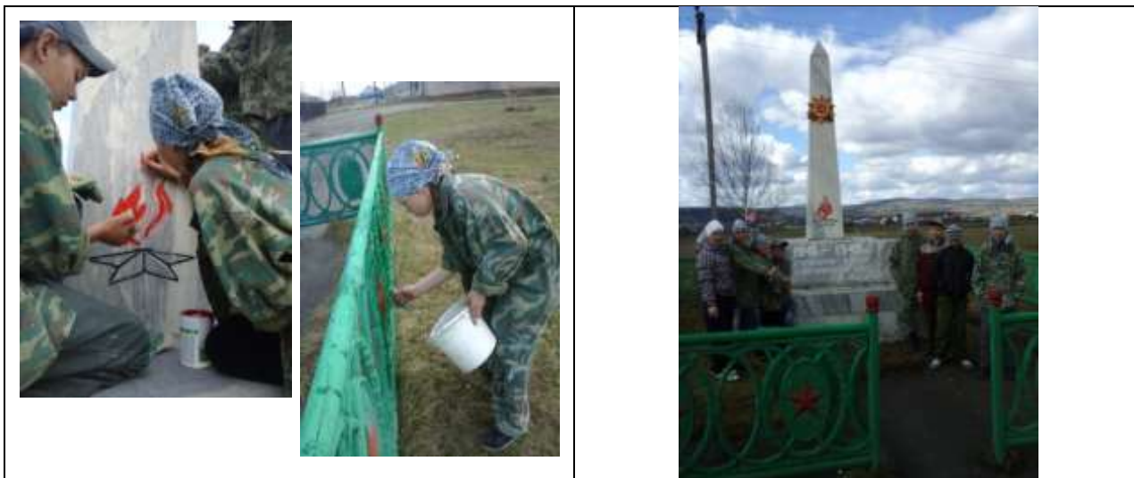
Акция «Виват, дополнительный корпус!»

Цель: уборка помещения дополнительного корпуса.